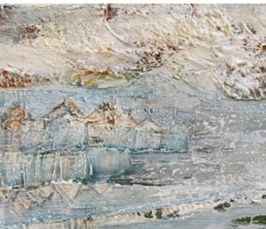
Ellen Cohen detail uit: 'verdronken land'