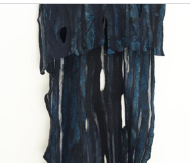
Joke Lunsing detail uit: 'ontwakend landschap'